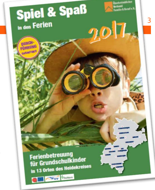
Jedes Jahr erscheint unsere Spiel & Spaß Ferienbroschüre für Grundschul Kinder im Alter zwischen 6 und 11 bzw. 12 Jahren.